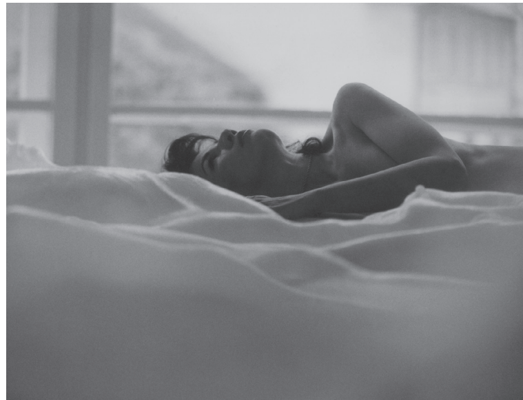
Irena Jůzová, 2007

Já sama se také neřadím do kategorie multimediálních umělců, přestože využívám v notné míře různá i nová média, jako součást vyjadřovacích prostředků, které však nepovažuji za primární. Při každém problému, kterým se chci zabývat, jsem na čistém začátku a nemohu se svazovat dovednostmi, které jsem si osvojila, nějakým řemeslem.