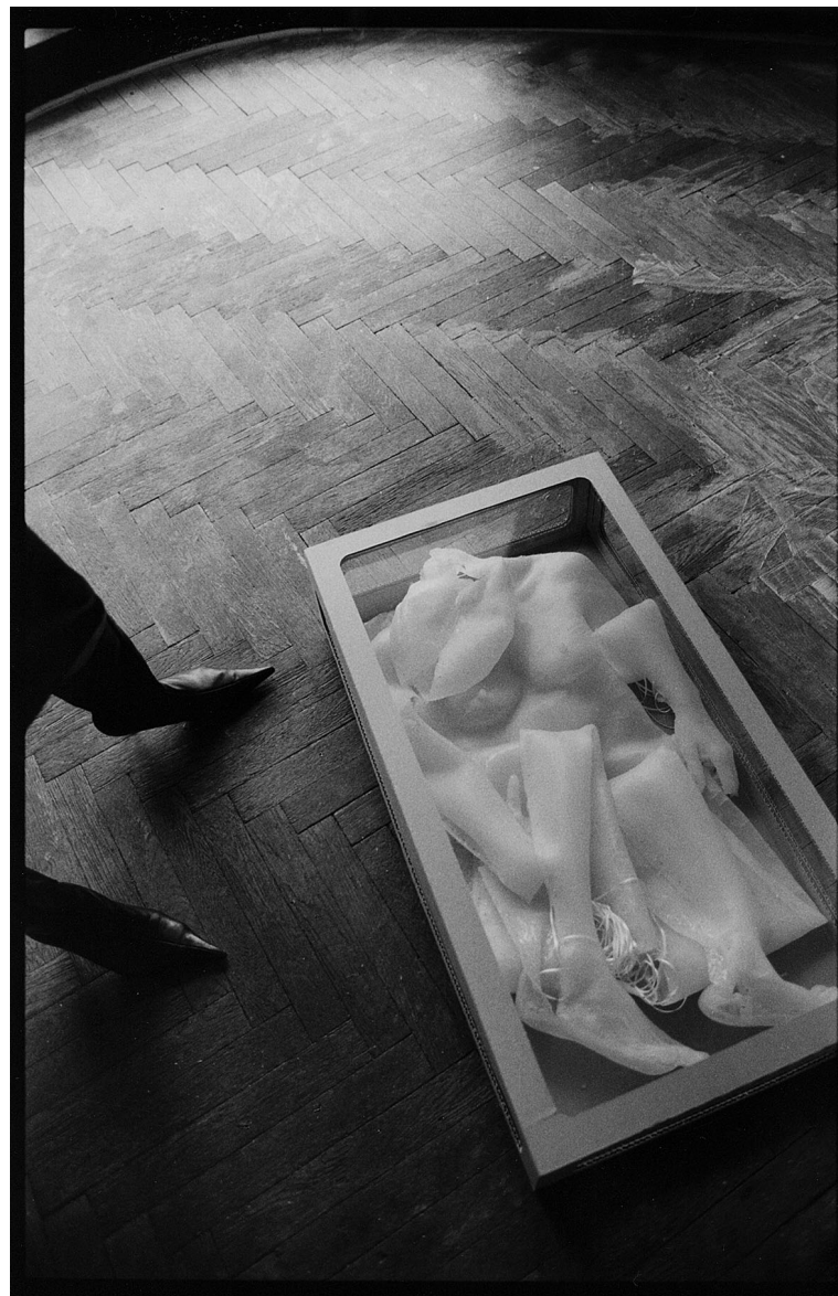
Kolekce - Série, 2007, kůže z transparentního lukoprenu v krabici, 125 x 50 x 20 cm