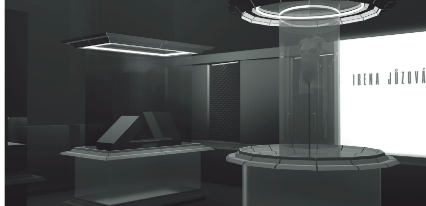
Kolečka - Série, 2007, vizualizace prostoru Česko - Slovenského pavilonu

Ve své práci pro Benátky kladete tedy důraz nikoliv na tělo, ale na odhozenou „slupku“. Zaprodala jste - obrazně řečeno - kůži. V současné době probíhá v Praze kontroverzní výstava mrtvých těl. Viděla jste ji a co si o tom v principu myslíte?