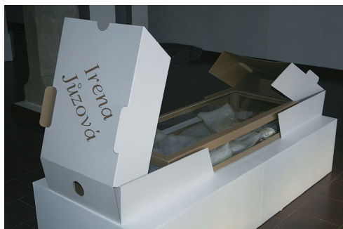
Kolekce - Série, 2007, kůže z transparentního lukoprenu v krabici, 125 x 50 x 20 cm

Moje kůže z celého těla jsou vystaveny ve třech skleněných vitrinách. Dvě kůže jsou složeny do papírových krabic s průhlednými víky chráněnými papírovými bočnicemi s mým monogramem. Krabice jsou vyrobeny v továrně a jsou složeny ze tří částí (vnitřní průhledná krabice pro kůži, boční papírová víka s mým jménem a nakonec se vše zasune do čistého bílého pouzdra). Jednotlivé části rukou a nohou jsou vystaveny na malých podstavcích ve výlohách a policích ve stěnách stavby. V centrální válcové vitrině je jedna kůže navlečena na torzo jako šaty.